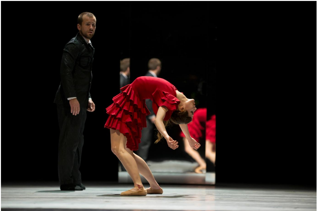
La CND interpretando "Carmen", con coreografía de Johan Inger.